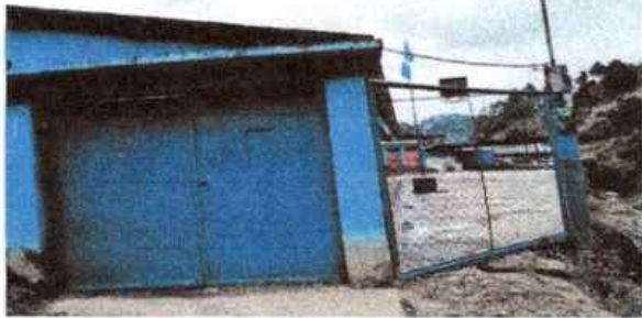
Foto 1. Sustitución de portón de metal