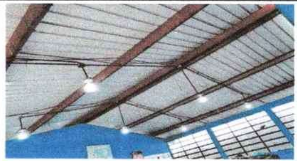
Foto 4. Sustitución de focos ahorradores