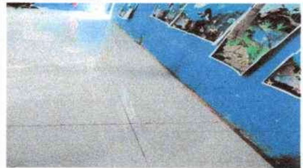
Foto 2. Sustitución de piso